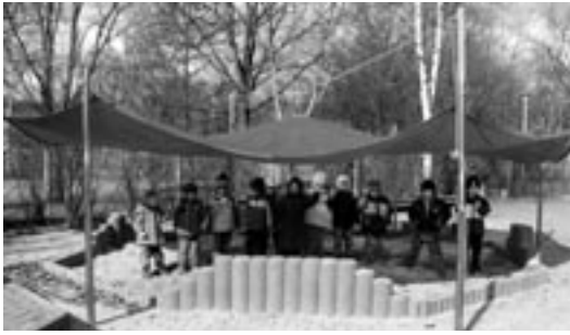
erneuerter Sandkasten mit Sonnensegel